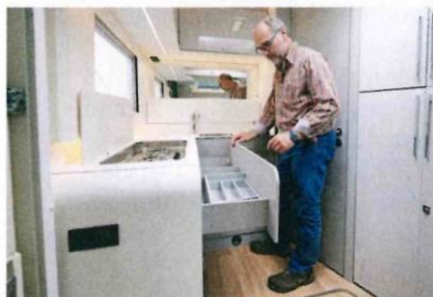
Cucina dallo stile moderno con materiali pratici e igienici.