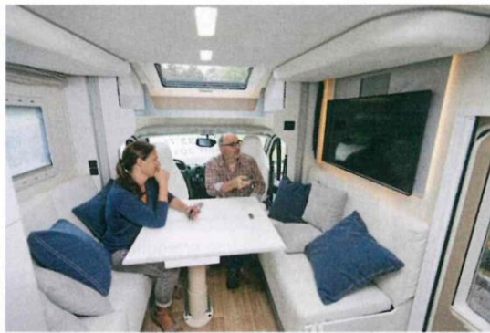
La dinette con mega TV può essere trasformata in due posti con cintura o in un letto matrimoniale.