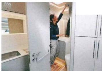
Il bagno con cabina doccia separabile è situato nella parte posteriore.