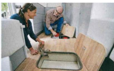
Nel doppio pavimento, oltre agli impianti resta ancora spazio per i bagagli.