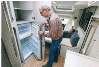
A sinistra vi sono dei grossi armadi che comprendono il frigorifero a compressore da 165 litri.